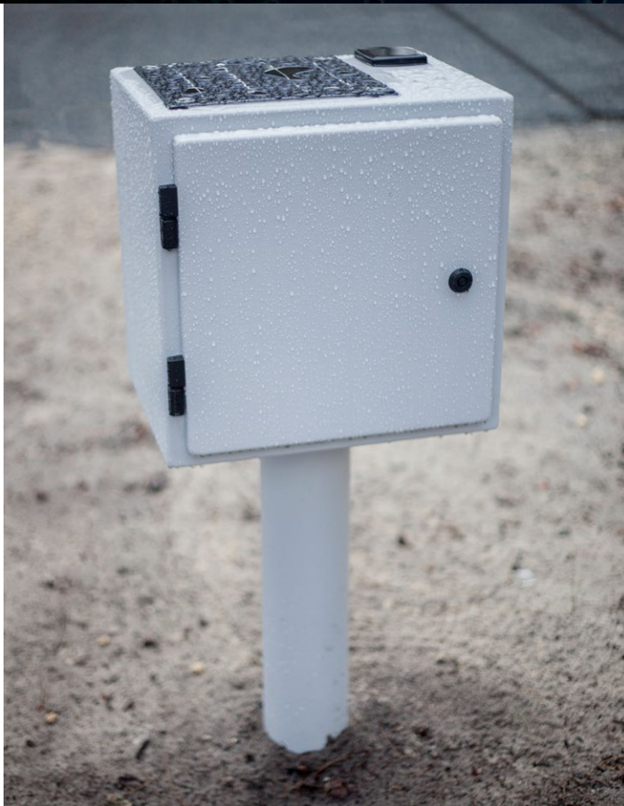
Caja a prueba de agua con antena 3G y panel solar.

Complementos: Módulo de acceso remoto FieldPod®