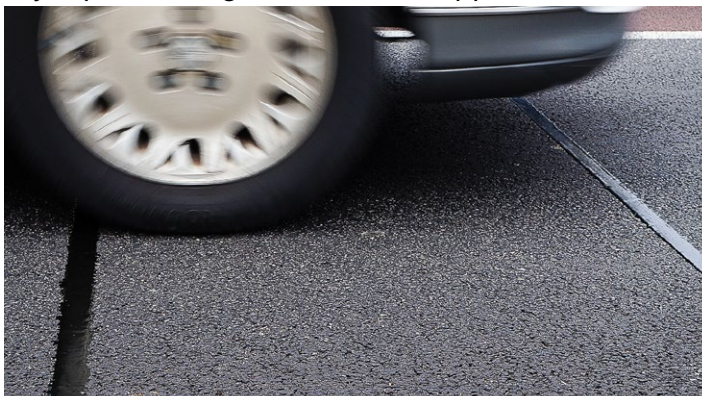
Integración de bajo perfil.